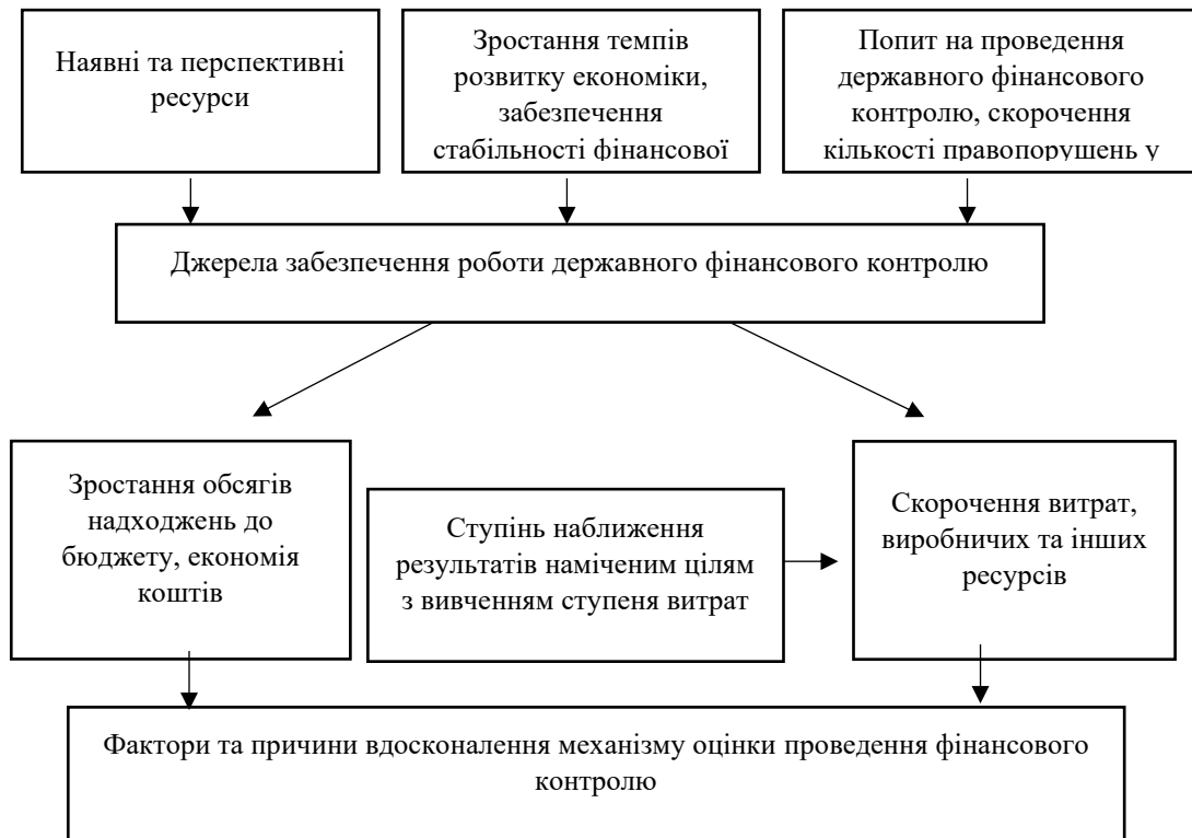
Рис. 3. Джерела забезпечення і основні чинники вдосконалення механізму державного фінансового контролю

Виходячи з такого підходу, метою оцінки ефективності проведення державного фінансового контролю повинно стати визначення ступеня наблизеності досягнутих результатів наміченим цілям із одночасним урахуванням понесених витрат (часу, матеріальних і грошових коштів, трудових ресурсів).