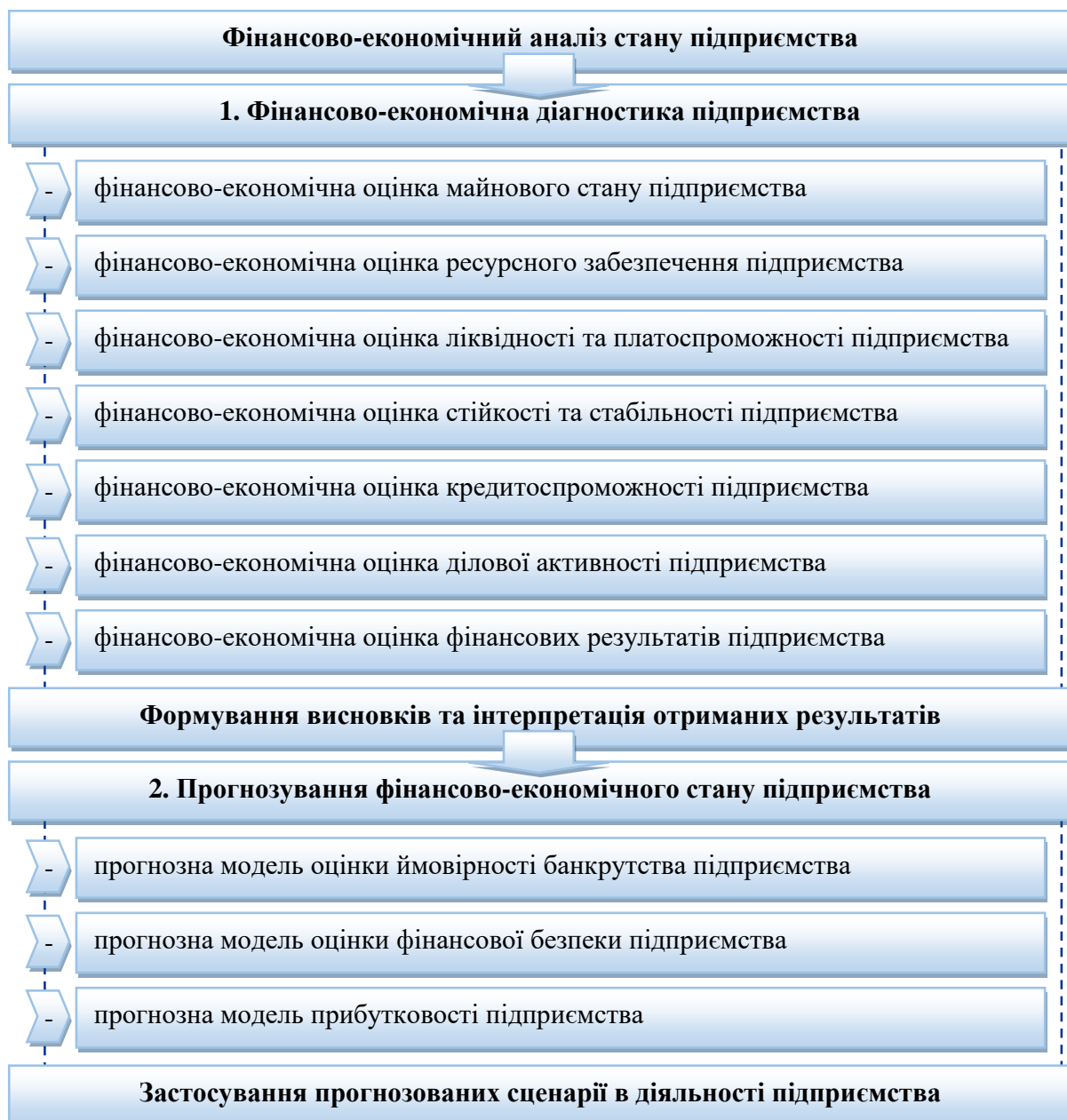
Рис. 1. Структура поетапності здійснення діагностики та прогнозування фінансово-економічного стану підприємства.

На рис. 1 зображено загальну структуру поетапності здійснення діагностики та прогнозування фінансово-економічного стану підприємства, яка складається із двох взаємопов'язаних блоків: