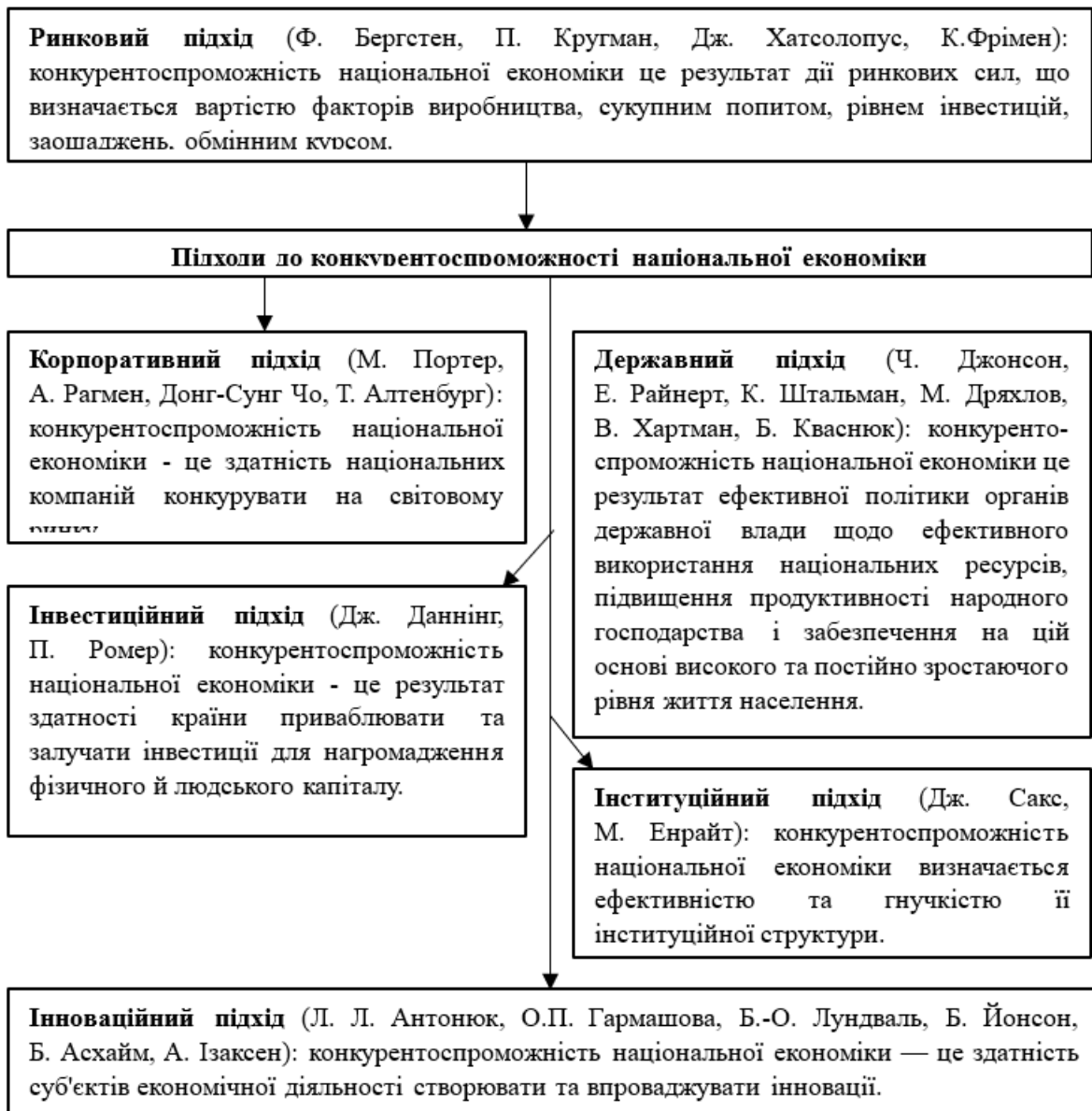
Рисунок 1. Підходи до конкурентоспроможності національної економіки [8, с. 19].

Тобто, підсумовуючи, конкурентоспроможність національної економіки може бути розглянута як результат ефективного управління перевагами (конкурентними, порівняльними, абсолютними) країни. Це дозволяє підприємствам виробляти товари і послуги, які користуються попитом як на внутрішньому, так і на зовнішньому ринках, а також сприяє зростанню добробуту країни.