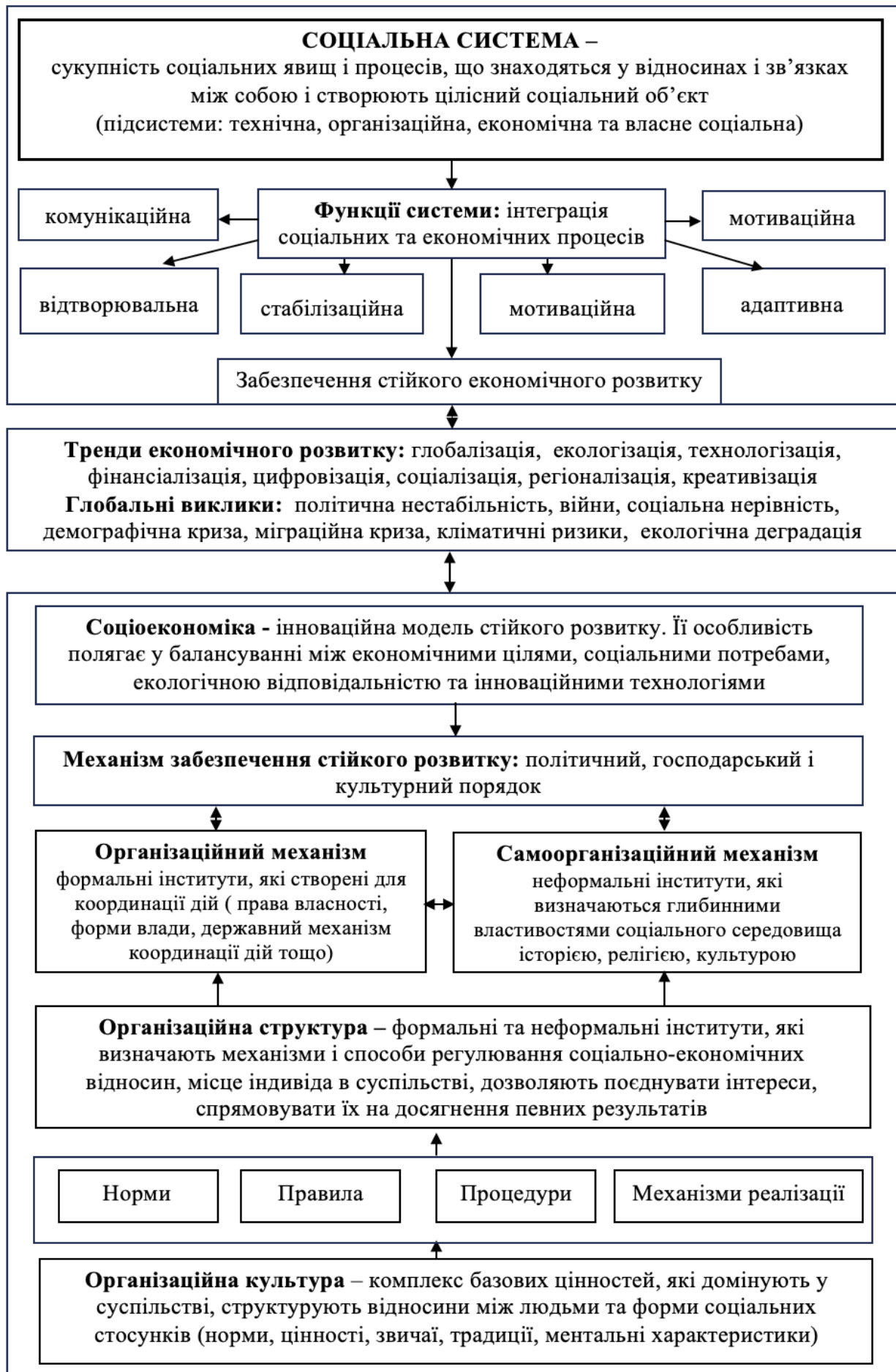
Рис.2. Формування моделі соціоекономіки та її вплив на розвиток соціальної системи.